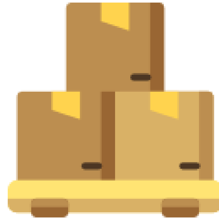
Cadena de suministro